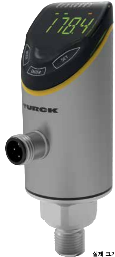
실제 크기의 이미지