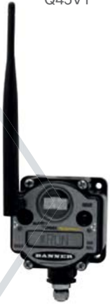
P6 성능 노드