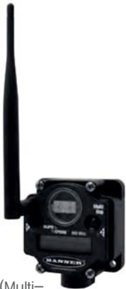
H6 멀티홉(Multi-hopping) 슬레이브