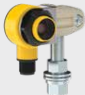
SMBAMS22P 스테인레스 스틸 모델: 모델명 끝에 -SS 추가